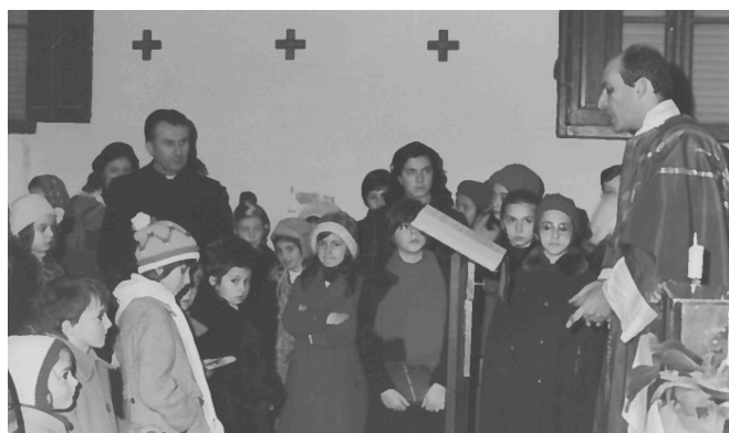
Una delle prime messe nel fienile adattato a chiesa della parrocchia dello Spirito Santo. Anno 1972.

Proprio perché sono parole d'amore, questa mia ricorrenza può essere paragonata al giubileo di un matrimonio. Voglio testimoniare che il mio Signore è stato fedele e mi ha riempito di doni.